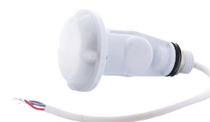
Capteur de mouvement HB01DMS-C

Accessoires pour répondre à tous les besoins de votre projet (vendus séparément)